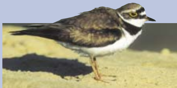
A kavicszátonyok ritka fészkelője a kis lile ( Charadrius dubius )

A Rába sokoldalúsága, változatossága miatt a tíz éves folyógazdálkodási akcióprogram program keretében szerzett tapasztalatok hazánk más folyóin is sikerrel alkalmazhatóak lesznek, modellként szolgálhatnak.