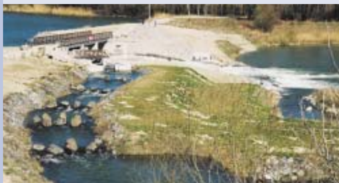
A szigetközi mintára a Rábán is megoldódhat a halak akadálytalan vándorlása (Denkpáli hallépcső)