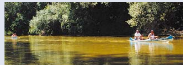
Vízitúrázók a Rábán.