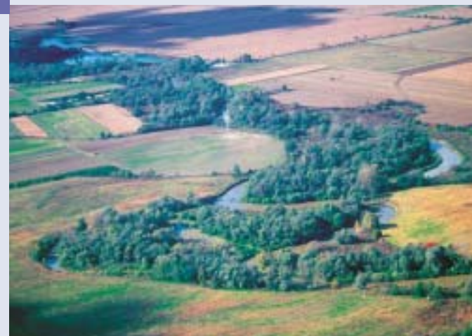
A Rába ma is hosszú szakaszon szabadon kanyarogva építi és rombolja medrét.