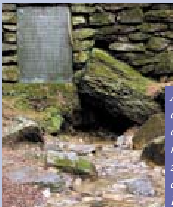
A Rába forrása Ausztriában, a Passali-Alpokban található, ahonnan gyors folyású, nagy esésű pataként zúdul lefelé a Passailli-medencébe

A Rába, Nyugat-Magyarország legjelentősebb folyója ökológiai folyosóként köti össze az Őrség és a Kisalföld eltérő jellegű, változatos tájait. Ausztriában 1200 m magasságban ered, Magyarországot Alsószölnöknél éri el 228 m-en, teljes hossza 322 km, melyből 211 km alkotja magyarországi szakaszát. Vízügyítő területének háromnegyede az országhatáron belül terül el.